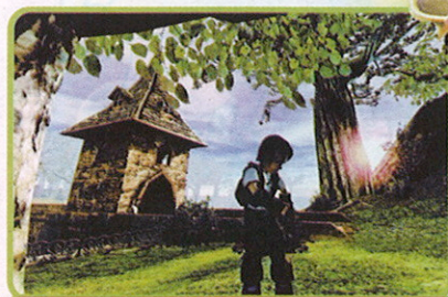
Im Unterschied zu den meisten anderen Lernspielen besticht „zweistein“ auch durch seine tolle Optik