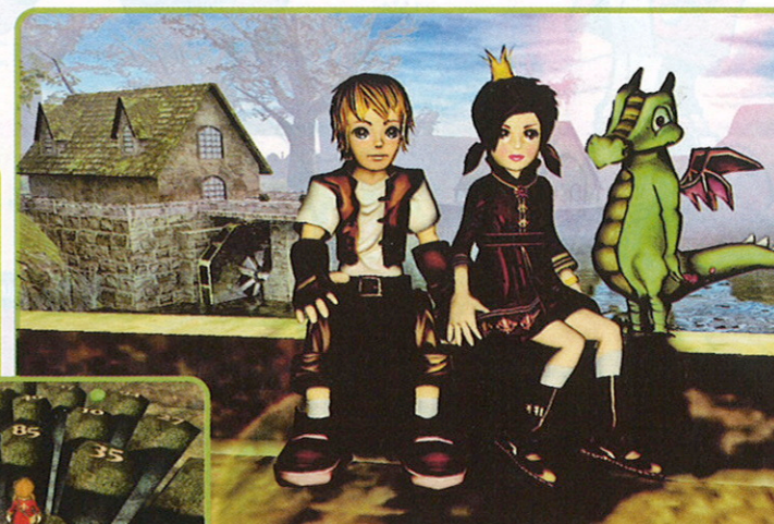
Nur als Team schafft man es, die Welt Trillion vor dem Untergang zu retten – denn auch die mathematischen Rätsel werden mit der Zeit immer kniffliger