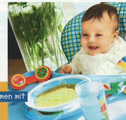
Schon die ganz Kleinen schlemmen mit

Die Italy Family Hotels haben sich in Ausstattung und Service auf Urlaub mit Kindern von 0 bis 12 Jahren eingestellt. Mitgliederhotels sind meist kleinere und mittlere Häuser, oftmals mit Müttern an der Spitze des Hotels. Beste Voraussetzungen also für einen individuellen und persönlichen Service mit individuellen Essens- und altersgerechten Mahlzeiten.