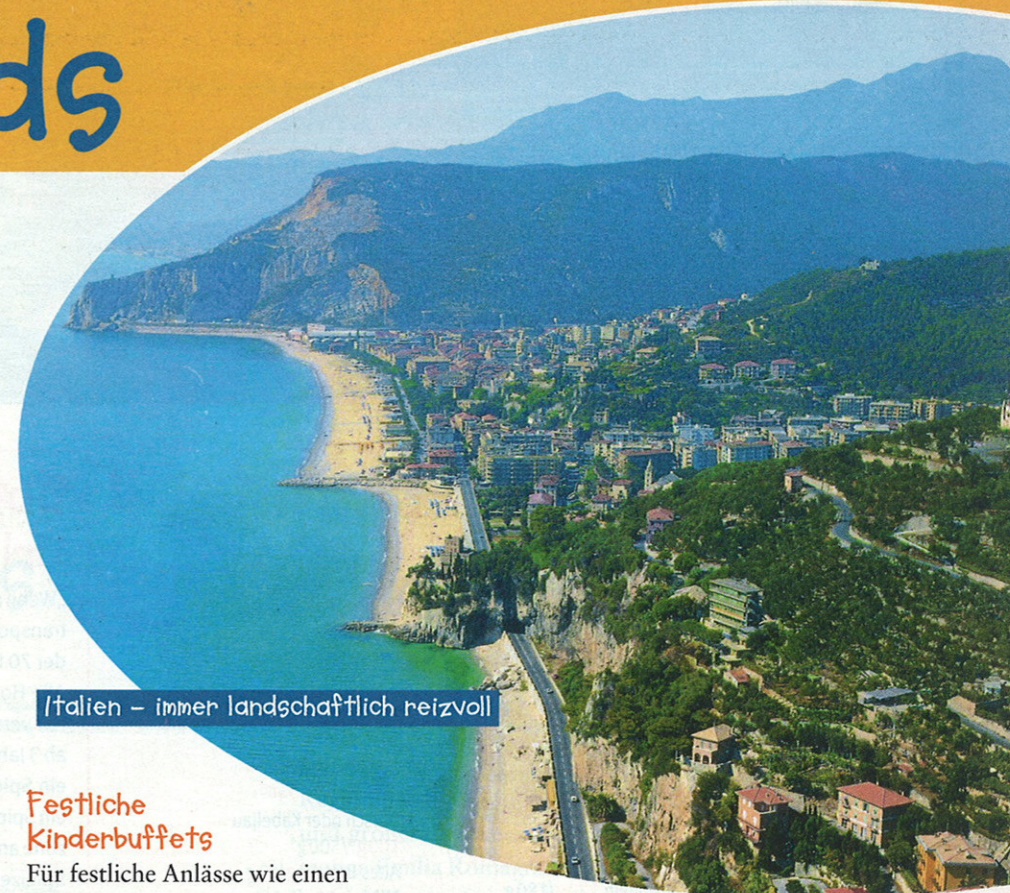
Italien – immer landschaftlich reizvoll

„Iiigitt, schon wieder Gemüse!“, das hören Eltern öfter einmal vom vitaminmüden Nachwuchs. Die Idee hinter den Rezepten der Italy Family Hotels ist es deshalb, gesunde Zutaten kindgerecht so zu verpacken, dass die Kleinen die Nährstoffe und gesunden Kohlehydrate möglichst gar nicht „merken“. Die Rezepte sind natürlich aus der schmackhaften italienischen Küche, lecker aufbereitet für Kinder.