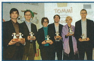
Preisträger auf der Buchmesse: alle sieben TOMMIS in den Händen der stolzen Gewinner

Am 17. Oktober ist auf der Frankfurter Buchmesse zum 7. Mal der Deutsche Kindersoftwarepreis TOMMI verliehen worden. Über 900 Mädchen und Jungen waren als Kinderjury an der Siegerfindung beteiligt und haben dafür Computer- und Konsolenspiele getestet und bewertet, die vorher von einer Fachjury aus über 80 Einreichungen ausgewählt worden waren. Neben dem etablierten Preis für Computerspiele und dem Sonderpreis Kindergarten & Vorschule gab es erstmals auch einen Konsolenpreis. Wir stellen Ihnen die Preisträger und die Zweit- und Drittplatzierten vor – mit den Begründungen der Kinderjury für die Preisvergabe.