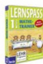
Mathematik 1. Klasse