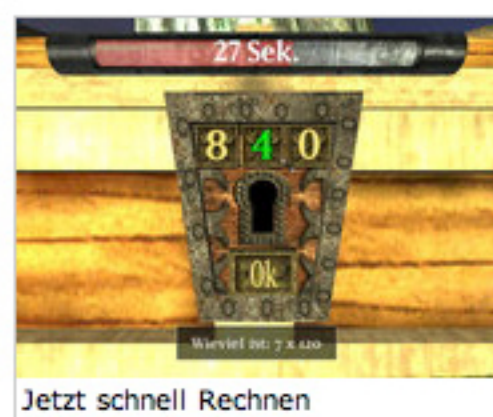
Jetzt schnell Rechnen