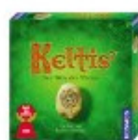
KOSMOS 6903590 - Keltis, Spiel des Jahres 2008