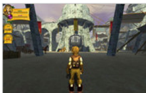
In Asban angekommen

Je weiter das Zaubhafte Trillion erkundet wird, desto mehr Charaktere kommen ins Spiel. Sind die Tore von Asban Stadt überwunden warten die ersten Ronger-Piraten auf die Gegenspieler Godrons . Diese ungemütlichen Zeitgenossen versperren hier und da den Weg und müssen durch kämpferische Auseinandersetzungen weichen. Auch Waldelfen und Gnome stehen auf der Seite des Magiers und müssen mit dem funkensprühenden Zauberstab oder dem Schwert vom Gegenteil überzeugt werden.