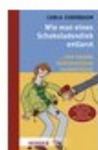
Wie man einen Schokoladendieb entlarvt